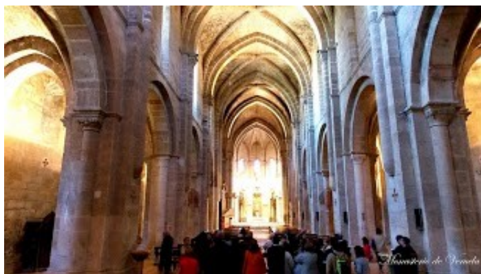
Església de Sta. Maria de Veruela

D'aquesta estança cal destacar el pasaplatos .