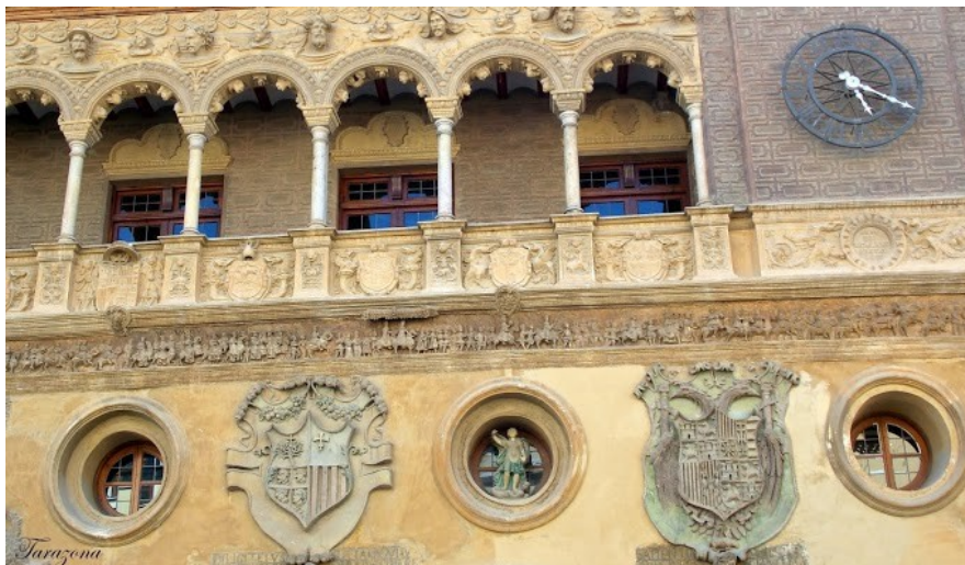
Ajuntament de Tarassona

De nou una altra guia, ens hi acompanya. Comencem el recorregut pel barri històric.