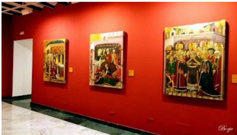
Museu de la Col·legiata. Borja

Les sales que vàrem visitar són molt interessants i amb peces molt importants. Entre elles el Crist jacent i les quinze taules que s'exposen de l'antic retaule major de la Col·legiata de Santa Maria encarregat l'any 1460.