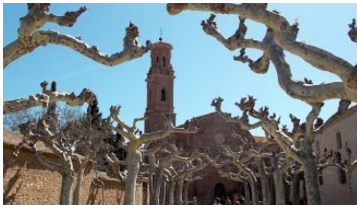
Monestir de Veruela

Seguint la història del monestir, la Comissió central de monuments artístics de Madrid va reclamar la seva conservació (any 1862-1863).