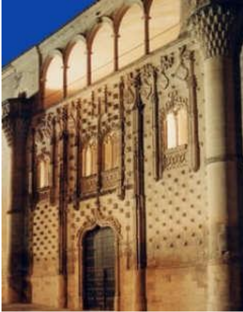
façana palau de Jabalquinto

El Palau de Jabalquinto i la Font de Santa Maria en Baeza son dos de les nombroses joies d'aquesta històrica ciutat de Jaén .