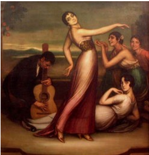
Alegrias / Julio Romero de Torres

En aquesta plaça hi ha el museu de Julio Romero de Torres, abans, però, va ser l'hospital de la Caritat.