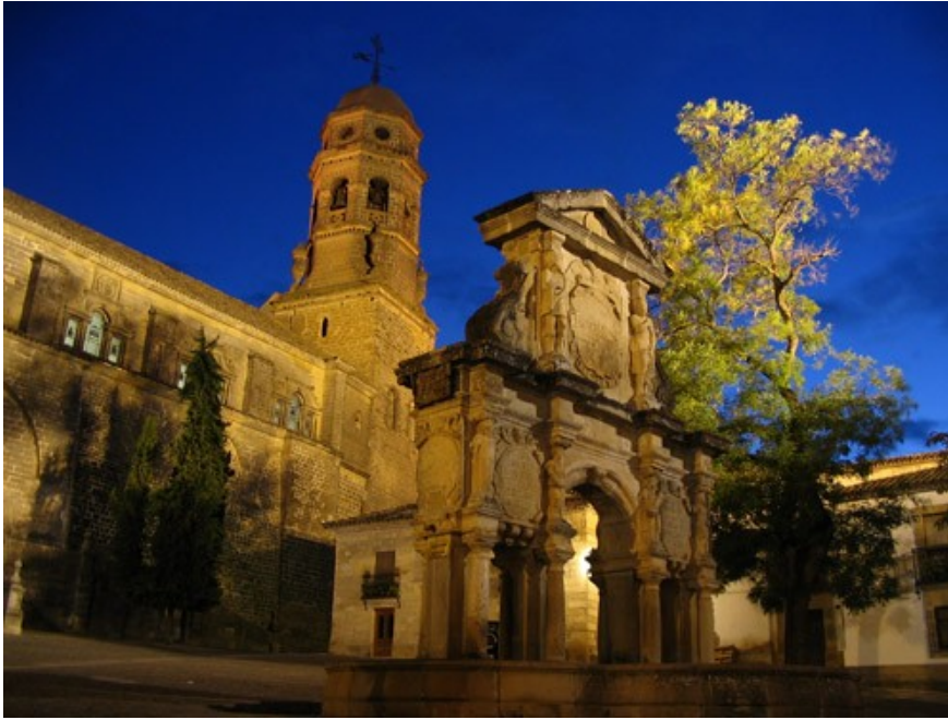
catedral de Baeza

Baeza, la primera ciutat andalusa en ser conquerida pels castellans en 1227 rere la lluita de la batalla de las Navas de Tolosa , recupera cada dia mes importància gràcies al turisme cultural d'interior. El 3 de juliol de 2003 la ciutat fou declarada Patrimoni de la Humanitat per la UNESCO juntament amb la ciutat veïna d'Ubeda.