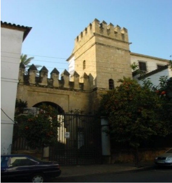
Palau dels Marquesos del Carpio

Casa fortalesa que es troba situada al carrer de San Fernando. L'origen d'aquest palau es remunta a l'època del rei Fernando III que va fer donació a la família Méndez de Sotomayor amb la finalitat de defensar i vigilar la muralla rere la conquesta de Còrdova l'any 1236.