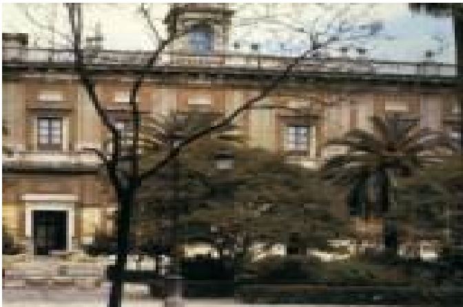
Casa contractació d'Índies

La capella de la mare de Déu, Verge dels navegants, retaule de Alejo Fernández, és on els reis Catòlics van rebre a Cristòfol Colom.