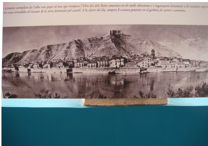
El poble vell

El pont es va inaugurar el 1929; el 1838 va ser destruït durant la Guerra Civil; en 1953 es va reconstruir.