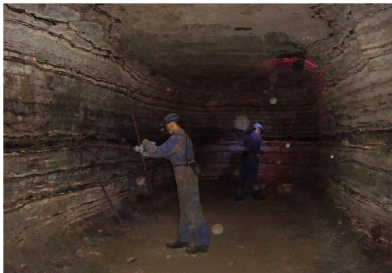
Perforant per posar barrenos

Museu de la Mina: Està situat a l'interior del turó al cim del qual s'alça el castell. La mina conté reserves de carbó de 6-7m. de gruix; encara s'explota.