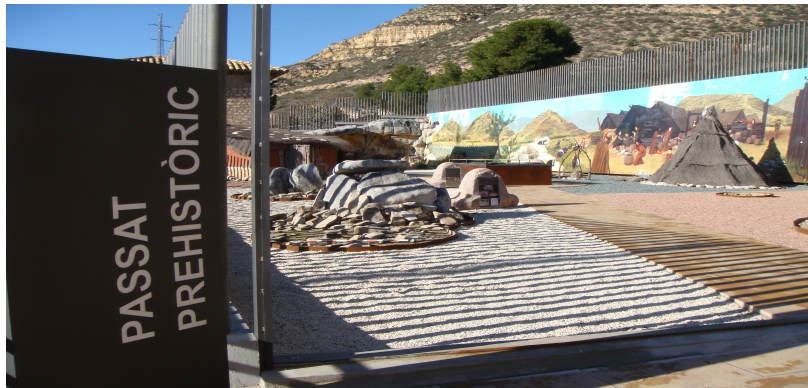
Entrada a l'espai de la Prehistòria

Reconstruccions d'objectes domèstics i funeraris procedents del poblat "Los Castellets" situat entre el segon i primer mil·lenni a. C.