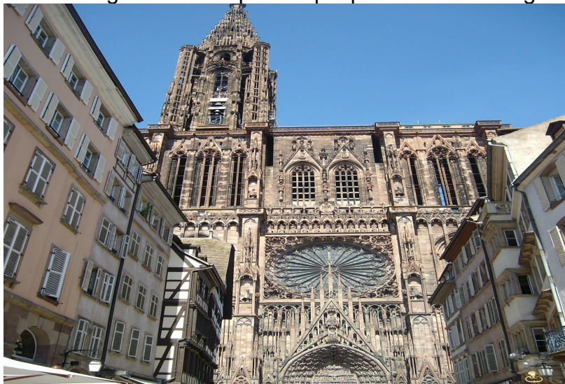
Catedral de Strasbourg

Com a ciutat mirall de l'Alsàcia, gaudeix de natura frondosa, arquitectura típica, gastronomia pròpia, cases amb entramats de fusta, de cridaners colors, i amb un bellíssim i florit centre històric, la Petite France, en una illa entornada per les aigües del riu Ill, declarat patrimoni de la humanitat per la UNESCO l'any 1988, i els diferents canals dispersos pels barris de la ciutat, gaudint d'una capa freàtica, on es troba la reserva d'aigua potable més gran d'Europa. La Petite France deu el seu nom a un antic hospital, se situa als voltants de la zona on es regula el canal d'aigua i les comportes que permeten la navegació.