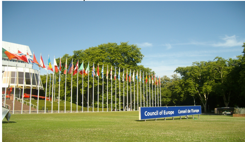
Consell d'Europa. Estrasbourg

regals realitzats per diferents països. Aquí tenen lloc les sessions plenàries, atès que les comissions tècniques del Parlament es reuneixen a Brussel·les.