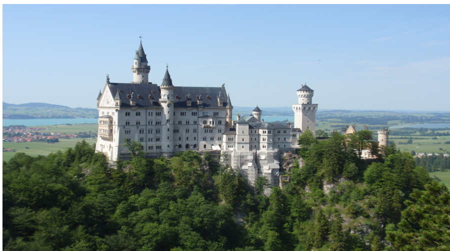
Castell de Neuschwanstein

Neuschwanstein, el palau més famós de Baviera que dona vida a una pura fantasia romàntica, entreteixint torres i murs, jugant en harmonia amb llacs i paisatge, situat proper a Füssen, i considerat "el somni boig" del seu rei. És el més fotografiat d'Alemanya i inspirador del castell de Disney i emblema d'Eurodisney. Es diu que el rei, amb aquesta construcció, desitjà ensenyar l'univers d'un artista a qui estimava de manera entranyable: Richard Wagner. Sorpren veure una completa xarxa elèctrica, el primer mòbil de la història amb una cobertura de sis metres. Una cuina que aprofitava la calor seguit les regles elaborades per Leonardo da Vinci. Cal remarcar que el rei va voler que aquesta construcció es realitzés en la seva totalitat amb matèria primera de Baviera i per habitants bavaresos.